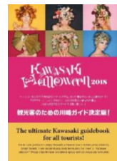
公式 パンフレット